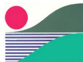
Волжского бассейна РАН